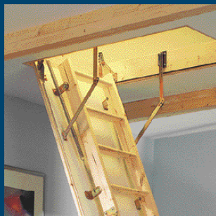
Půdní skládací schody