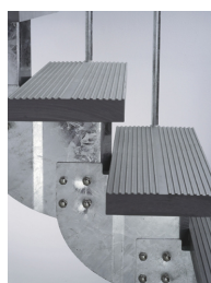
Regulace výšky stupně