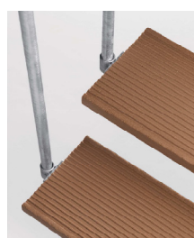
Trimax: hnědé nášlapy